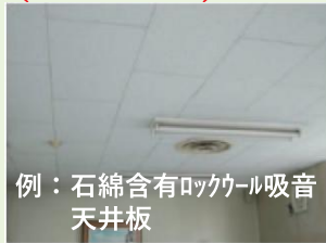
例：石綿含有ロックウール吸音天井板