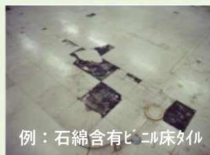
例：石綿含有ビニル床タイル