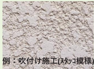
例：吹付け施工(スタッコ模様)