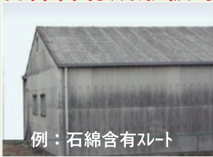
例：石綿含有スレート